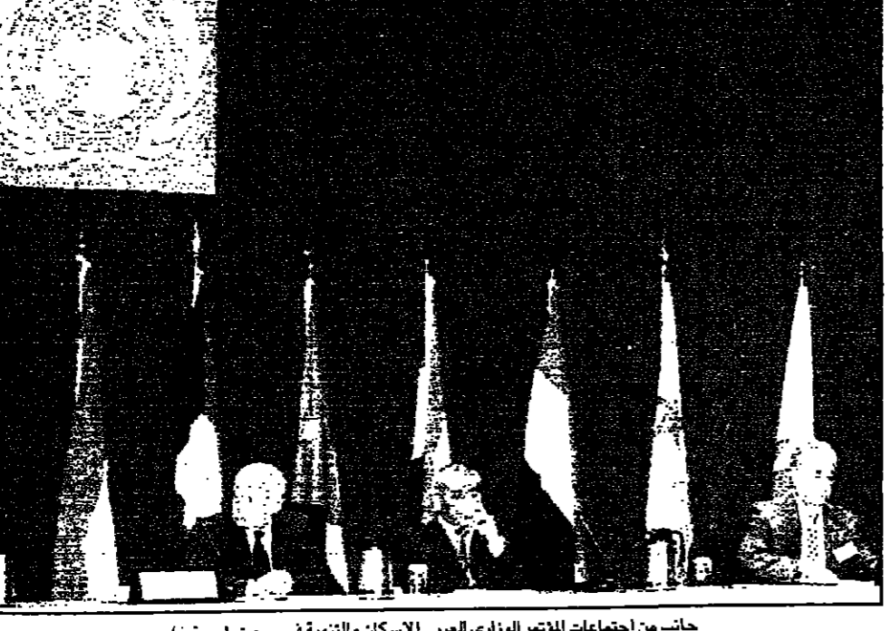
جانب من اجتماعات المؤتمر الوزاري العربي للاسكان والتنمية في بيروت

بيروت - القدس العربي: - من ندى عبد الحميد: فيديو اليوم ليلة الاستفتاء على الدستور في لبنان، وفيه صور الرئيس الجديد كرزور المسؤولون اللبنانيون لتحميم نفسه وقصودان الأمل في تصحيح مسار لبنان، وفيه صور الرئيس الجديد كرزور المسؤولون اللبنانيون لتحميم نفسه وقصودان الأمل في تصحيح مسار لبنان. وقال جودة في بيانته التي بثتها قناة الجزيرة الفضائية، إن موقف الأردن من القضية الفلسطينية لم يتغير أبداً، وسيبقى الرافضاً لأي محاولات لتغيير الوضع القائم في المدينة المقدسة.